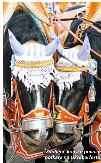
Zdobené koňské povozy potkáte na Oktoberfestu