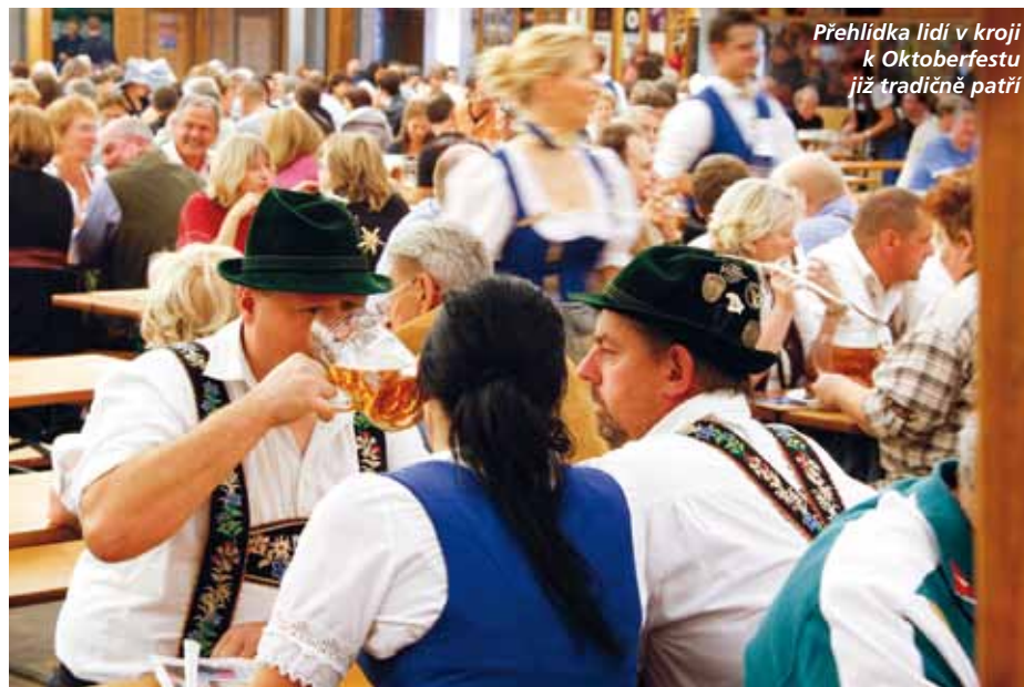
Přehlídka lidí v kroji k Oktoberfestu již tradičně patří

Kvůli lepšímu počasí se v roce 1872 slavnosti posunuly z října na září. Jejich začátek tak připadá na první sobotu po 15. září a posledním dnem je první říjnová neděle. Pivní stany jsou otevřené přes týden od 10 do 23.30 hodin a o víkendech se otevírají o hodinu dříve. Tento rok se slavnosti konají 17. 9. až 3. 10. 2011. Více se dočtete na www.oktoberfest.de .