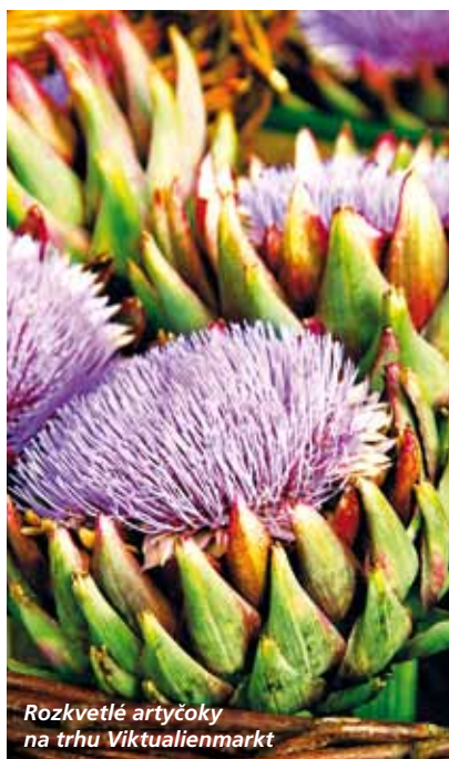
Rozkvetlé artyčoky na trhu Viktualienmarkt