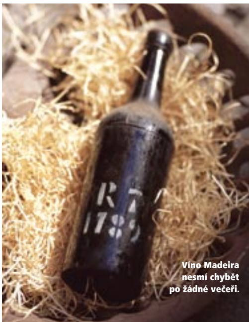
Víno Madeira nesmí chybět po žádné večeři.