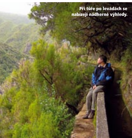
Při túře po levadách se nabízejí nádherné výhledy.