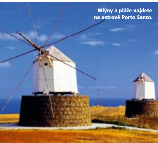
Mlýny a pláže najdete na ostrově Porto Santo.

kaštanový koláč i kaštanový likér. Samozřejmě za neustálého vybuchování všudypřítomných rachejtlí. Nad vesničkou je nádherná vyhlídka na celé údolí, kde můžete přemýšlet nad vznikem jeho názvu... Naproti přes údolí je další krásná vyhlídka v Bocca da Coridda. Můžete tu nechat zaparkované auto a vydat se na túru vinoucí se podél hřebene. Dojít lze až k průsmyku Boca do Encumenada. Odtud uvidíte moře na obou stranách pobřeží. Madeira je ostrov dlouhý jen 57 km a široký 22 km, a tak ho v pohodě objedete za jediný den. Díky tomu, že sem zasahuje GOLFský proud, se mu přezdívá „ostrov věčného jara“ (naše návštěva je zřejmě výjimkou, která potvrzuje pravidlo) a teplota vody tam neklesne ani v zimě pod 18 stupňů Celsia.