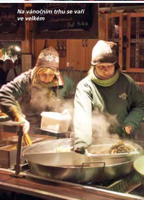
Na vánočním trhu se vaří ve velkém

Svařené víno z bezu. Punč z vaječného koňaku. Pečená jablíčka. Smažené tvarohové koule. Pečeně z vola... To vše můžete ochutnat na nejstarším německém vánočním trhu.