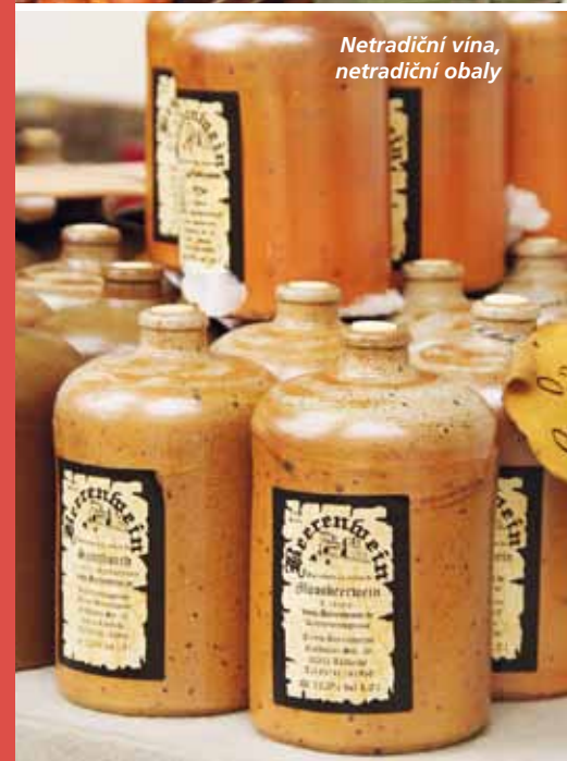
Netradiční vína, netradiční obaly

Svařené víno z bezu. Punč z vaječného koňaku. Pečená jablíčka. Smažené tvarohové koule. Pečeně z vola... To vše můžete ochutnat na nejstarším německém vánočním trhu.