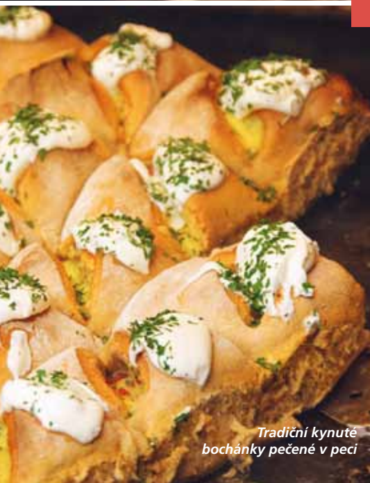
Tradiční kynuté bochánky pečené v peci