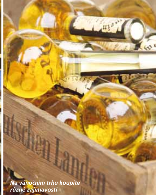
Na vánočním trhu koupíte různé zajímavosti