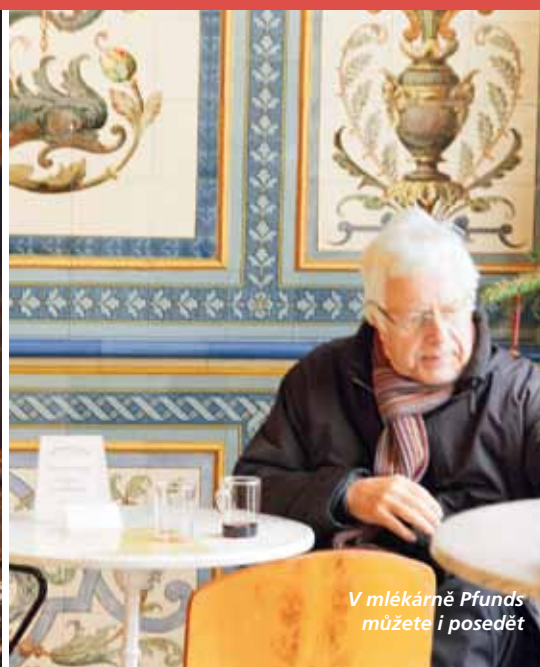
V mlékárně Pfunds můžete i posedět