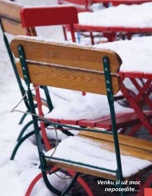
Venku si už moc neposedíte...