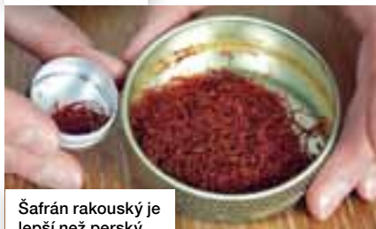
Šafrán rakouský je lepší než perský.