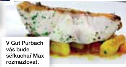
V Gut Purbach vás bude šéfkuchař Max rozmazlovat.