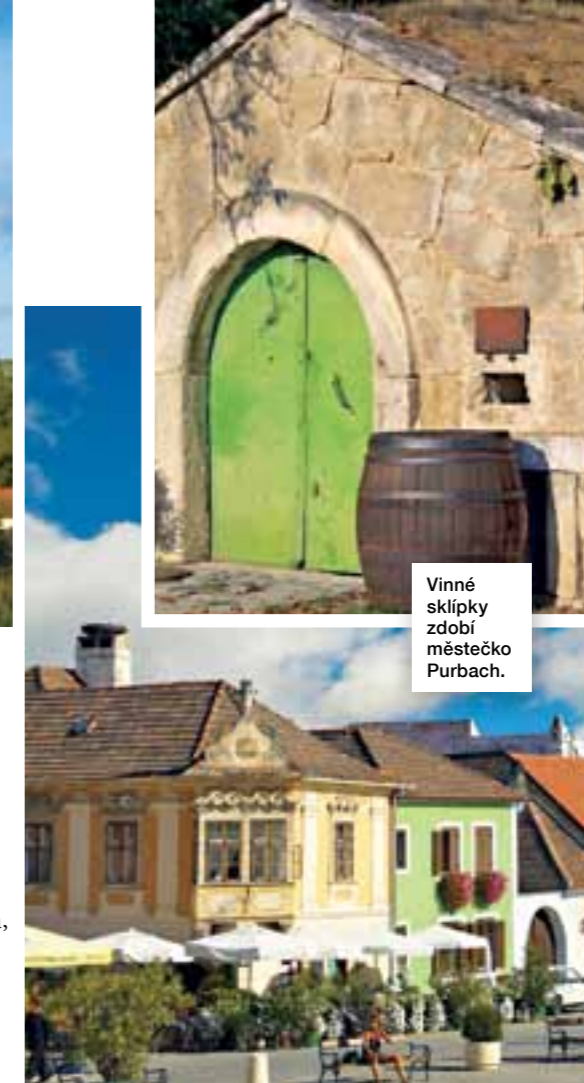
Malebný Rust je nejmenším statutárním městem v Rakousku.