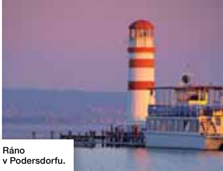
Ráno v Podersdorfu.