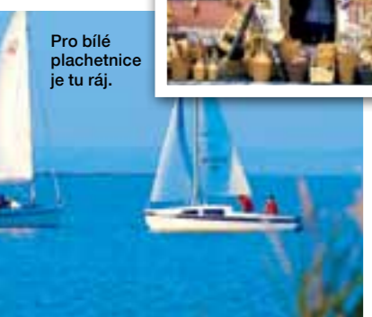
Pro bílé plachetnice je tu ráj.