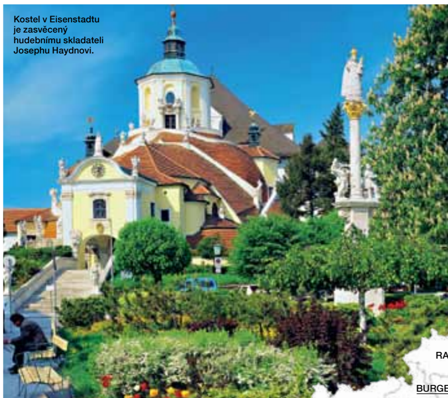
Kostel v Eisenstadtu je zasvěcený hudebnímu skladateli Josephu Haydnovi.