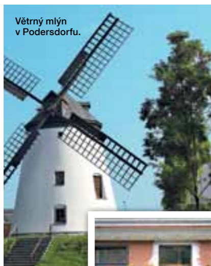
Větrný mlýn v Podersdorfu.