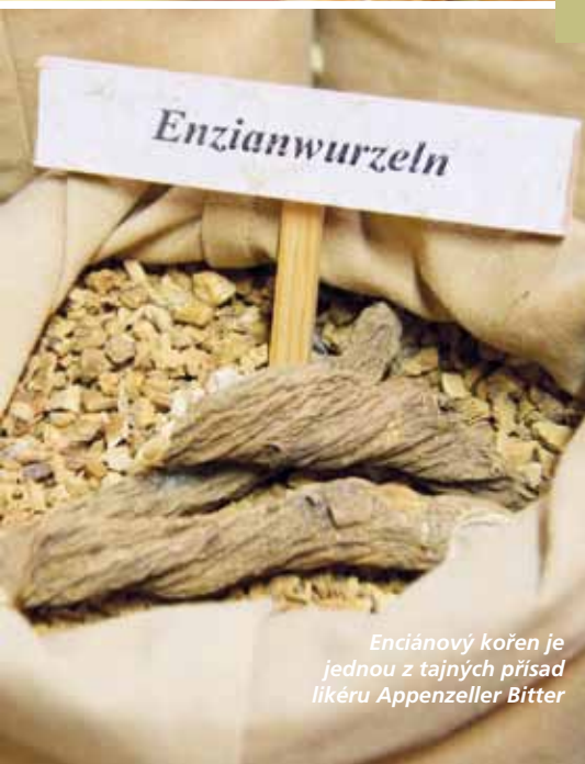
Enciánový kořen je jednou z tajných přísad likéru Appenzeller Bitter