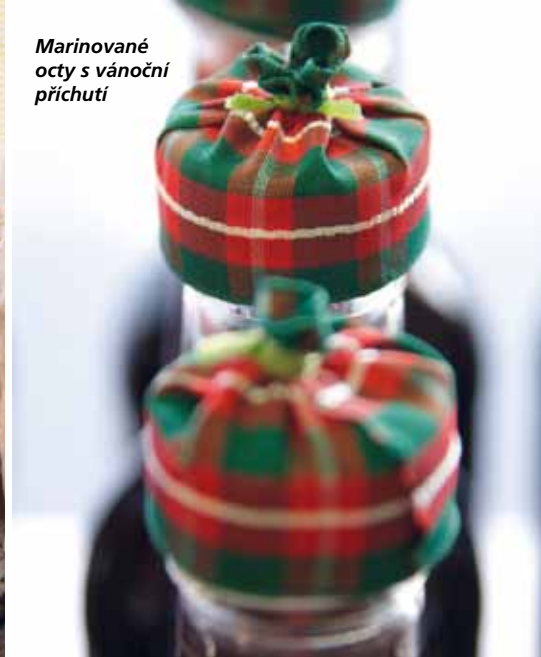
Marinované octy s vánoční příchutí