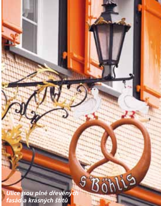
Ulice jsou plné dřevěných fasád a krásných štítů

Na své si zde přijde sportovec i lenoch. Můžete se tu nechat naložit do bylinkové koupele, nebo turistit. A přitom všem skvěle jíst!