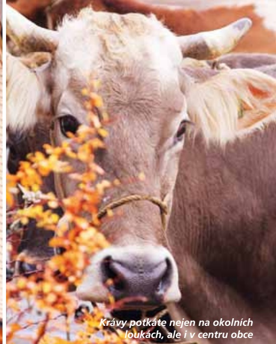
Krávy potkáte nejen na okolních loukách, ale i v centru obce