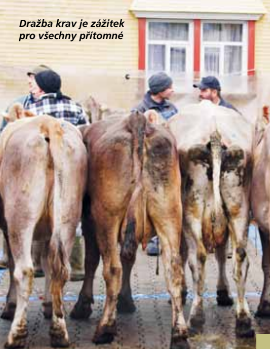
Dražba krav je zážitek pro všechny přítomné