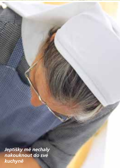
Jeptišky mě nechaly nakouknout do své kuchyně

Appenzell vás nepřestane překvapovat. Stejně jako místní počasí. Ráno se probudíte do upršeného dne, v poledne si vychutnáte nadílku sněhu a odpoledne chytáte sluneční paprsky.