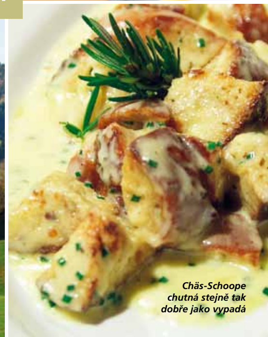
Chäs-Schoope chutná stejně tak dobře jako vypadá